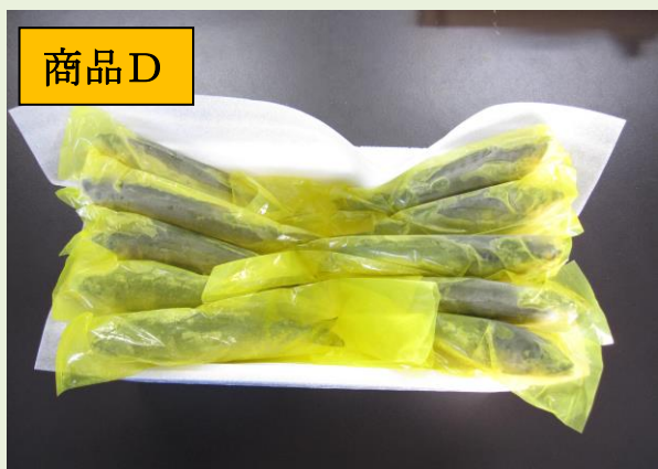
冷凍あゆ柑味鮎10尾